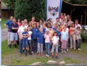
Fahrt ins Blaue